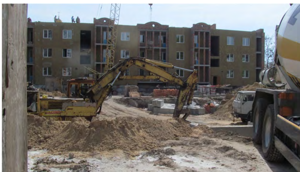
Рис. 3. Будівництво житлового будинку на вул. Князя Чорного 4