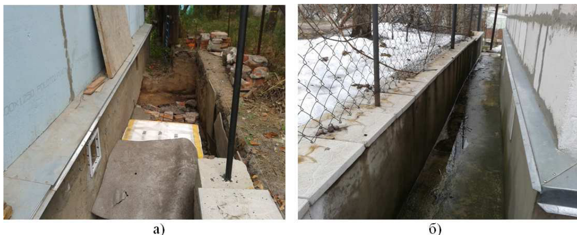
Рис. 2. Фото об'єкта з підсиленням запропонованим методом: а – під час виконання робіт; б – фото після 4 років експлуатації об'єкта

Спосіб підсилення фундаментів включає підсилення основ фундаментів та влаштування підпірної стінки між схилом і будинком, який полягає в тому, що наявний фундамент з'єднується монолітною армованою плитою з новим фундаментом та підпірною стінкою (рис. 2).