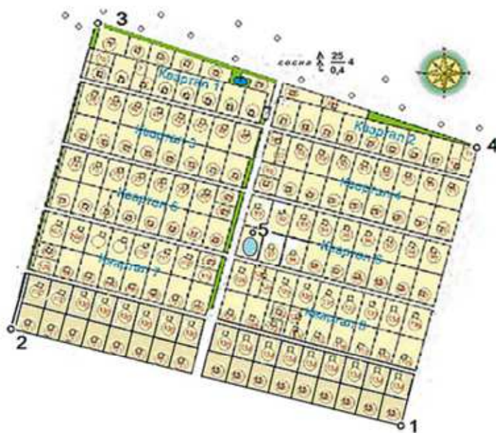
Рис. 2. План садово-городнього товариства

На пунктах 1 та 2 були виконані спостереження з використанням GPS-приймача та визначені висоти і прямокутні координати цих пунктів у системі координат УСК 2000. На пунктах 3 та 4 такі спостереження давали нестабільні результати, оскільки північна частина земельного масиву межувала з сосновим лісом із висотою дерев близько 25 м (рис. 2), що приводило до багатопроменевості сигналу від супутників GPS та створенню додаткових завад. Оскільки всередині земельного масиву розташовувалась водонапірна башта з блискавковідводом, то доцільно використати саме полюсний метод, обравши блискавковідвід за полюс, який позначено на рис. 2 цифрою 5.