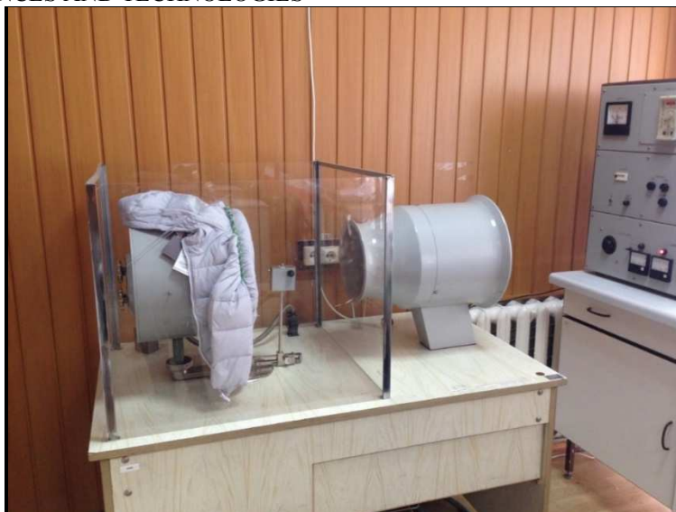
Рис. 2. Визначення показника сумарного теплового опору зразка 1 за допомогою приладу ПТС-225

Час охолодження пластини 1 зразка (пір'яно-пуховий наповнювач) склав 1367 с., а 2 зразка (синтетичний текстильний наповнювач) – 1433 с. Після проведення випробувань відбувалась обробка отриманих результатів, згідно з формулами 1-5: