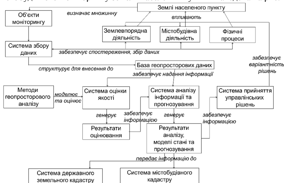
Рис. 2. Узагальнена онтологічна модель містобудівного моніторингу земель населеного пункту

Містобудівний моніторинг земель населених пунктів є одним із видів моніторингових систем, а тому успадковує від них усі основні властивості, загальні цілі, призначення, методичне забезпечення. Методичний базис моніторингу спирається на геоінформаційний та кваліметричний наукові підходи, в частині структурної організації, оброблення даних та методів оцінювання сталості розвитку населених пунктів. Узагальнена онтологічна модель містобудівного моніторингу земель населених пунктів наведена на рис. 2.