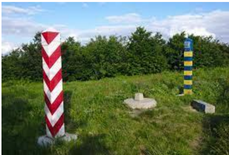
Рис. 1. Державний кордон України та Республіки Польща, ділянка розташовану у Львівській області, Самбірський район, Добромільська міська рада (за межами населених пунктів)