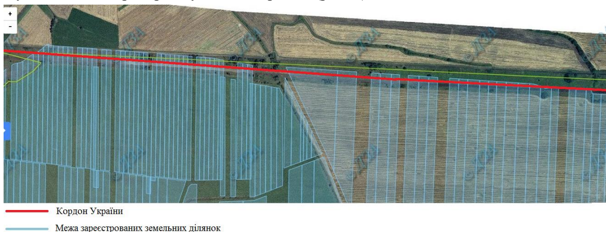
Рис. 2. Елемент публічної карти України з відображенням кордону України та зареєстрованими земельними ділянками

Розглянемо детальніше деякі з них. На публічній кадастровій карті можемо спостерігати, що зареєстровані земельні ділянки попадають не лише в межу прикордонної смуги, але й на територію сусідньої держави (рис. 2).