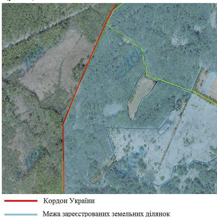
Рис. 3. Елемент публічної карти України з відображенням кордону України та зареєстрованими земельними ділянками з цільовим призначенням 09.01

Також перешкодами у реєстрації земель прикордонної смуги, є випадки, коли в її межу потрапляють некоректно проінвентаризовані починаючи з 2019 року землі запасу та ділянки 09.01, з цільовим призначенням для ведення лісового господарства й пов'язаних із ним послуг (рис. 3).