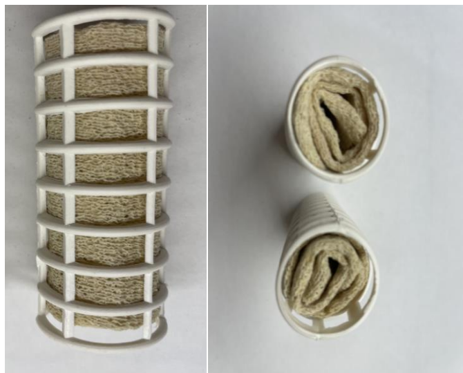
Рис. 1. «Касета» із зразком наповненого трикотажного матеріалу

З наповнених трикотажних полотен шляхом багаторазового складання та скручування матеріалу й укладання в пластиковий корпус були виготовлені свого роду «касети» (рис. 1), які занурювались у розчин барвника метиленового синього так, щоб вони рівномірно омивались розчином з усіх боків. Під час обводнення відбувалось набухання наповненого трикотажного матеріалу.