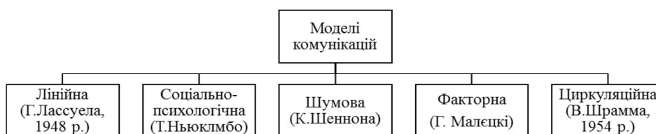
Рис. 2. Моделі комунікацій