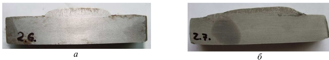
Рис. 2. Характер макроструктуры наплавки ленточным электродом: а – с принудительным переносом электродного металла ст. 3, V=50 мм, \delta=1,5 мм; б – без принудительного переноса электродного металла Св-08-А, V=60 мм, \delta=1,5 мм