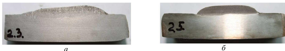
Рис. 3. Характер макроструктуры наплавки ленточным электродом без принудительного переноса электродного металла: а – Св-08-А, V=60 мм, \delta=1,5 мм; б – ст. 3, V=40 мм, \delta=0,5 мм

Оценка качества формирования зоны проплавления производилась по макрошлифам наплавленных валиков путем измерения значений глубины проплавления основного металла в 5–7 точках и определения диапазона разброса измеренных величин. Также определялся разброс геометрических параметров зоны наплавки и средние значения глубины проплавления и высоты усиления наплавленного валика.