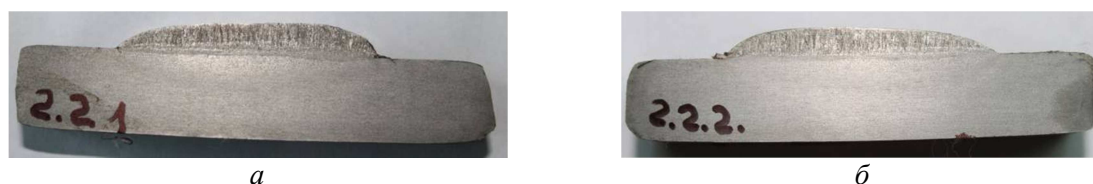
Рис. 1. Характер макроструктуры наплавки ленточным электродом с принудительным переносом электродного металла Св-08-А: а – B=40 мм, \delta=1,5 мм; б – B=50 мм, \delta=1,5 мм

Характеры макроструктур наплавки под флюсом ленточным электродом сплошного сечения без принудительного переноса показаны на рис. 1–3: