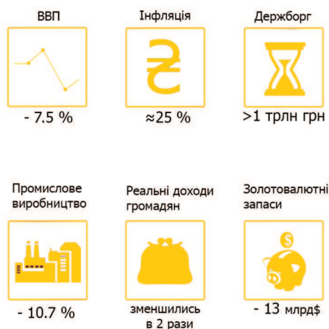
Рис. 2. Економічні антирекорди України в 2014 р.

В умовах зростаючого ринку не треба покладатися на бюджетне фінансування, а потрібно активно залучати інвесторів. А хто в цій конкурентній боротьбі за інвестиції програє, той ризикує залишитися за межами інвестиційного процесу. У зв'язку з цим в Україні має бути створений не просто сприятливий, а конкурентоспроможний інвестиційний клімат.