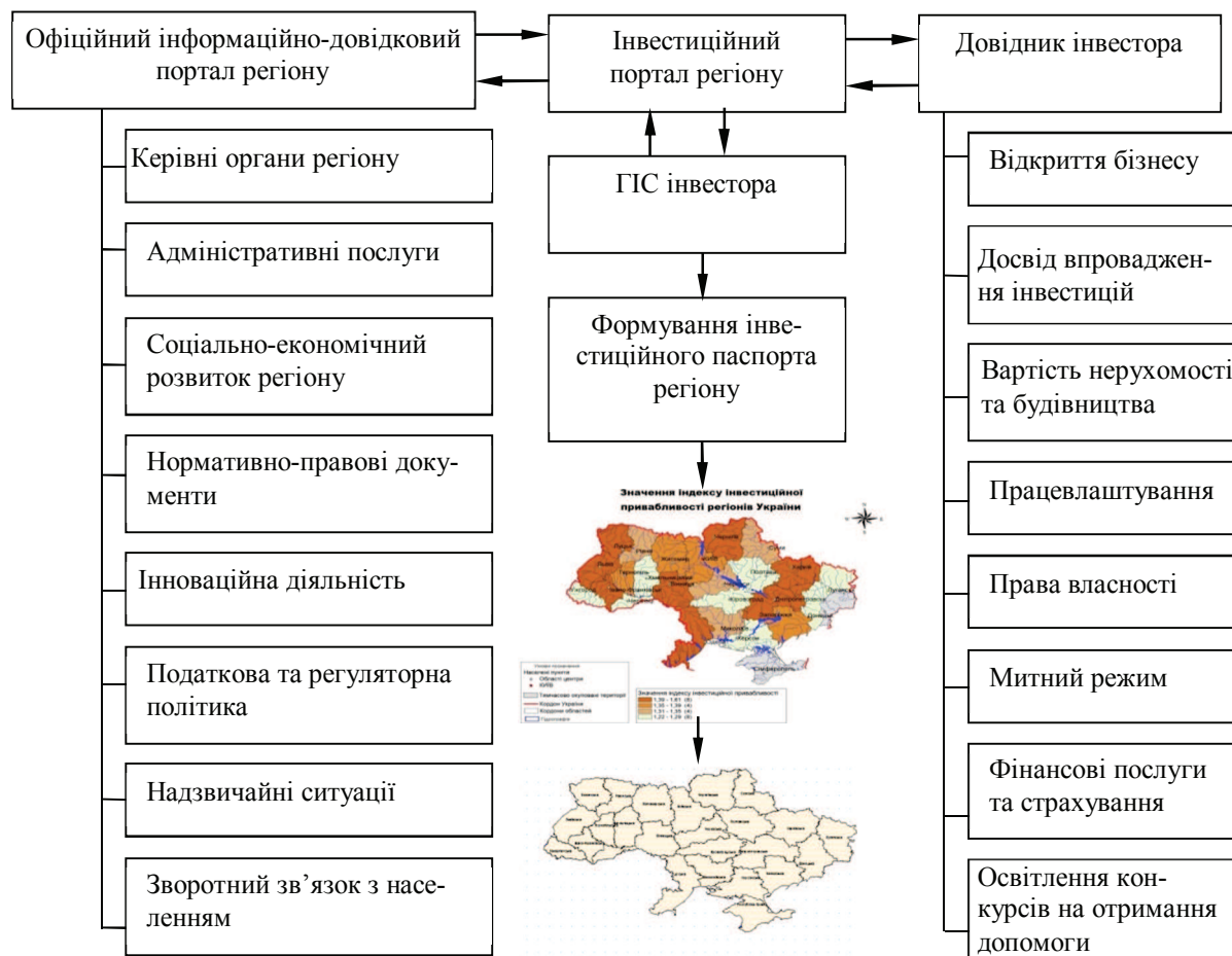
Рис. 3. Завдання інвестиційного порталу

Необхідно володіти достовірними відомостями про власників фірми-інвестора і його керівництво, історії діяльності підприємства, структурі управління виробництвом і збутом, наявності та рівень самостійності структурних підрозділів як у регіонах країни, так і за її межами тощо. Щоб уникнути ризику, необхідно використовувати інформацію, яку містять такі джерела: