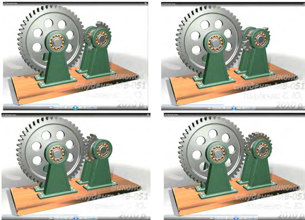
Рис. 3. Зубчастий сектор

Зубчастий сектор (рис. 3), закріплений на валу, періодично повертається тільки протягом того часу, коли його зубці знаходяться в зачепленні з зубцями колеса, установленого на іншому валу. У цьому механізмі не можливо регулювати величину кута повороту колеса, тому він, як і мальтійські механізми, використовується в основному в багатопозиційних пристроях.