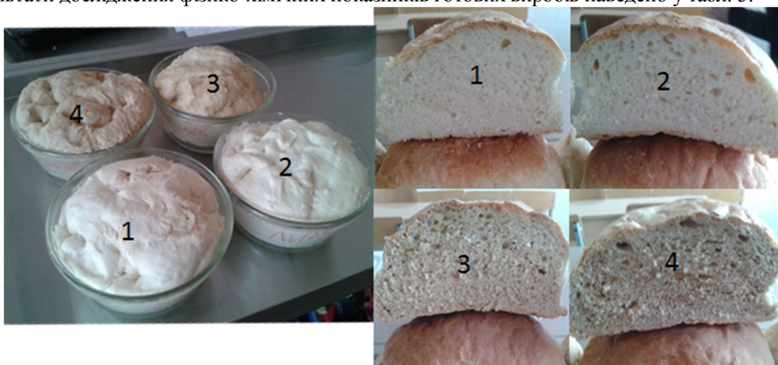
Рис. 2. Тісто та хліб після випічки: 1 – без добавок; 2 – з добавкою соку лимона; 3 – з добавкою цикорію; 4 – з добавкою кави

Одержані зразки хліба з використанням добавок мають правильну форму і пропечений м'якуш, не вологий на дотик, еластичний, після легкого натиснення пальцями м'якуш набував початкової форми (рис. 2). Колір хліба з добавкою цикорію та кави дещо темніший, порівняно з хлібом з соком лимона (в якого м'якуш має світліший відтінок порівняно з контрольним зразком). Смак і запах хліба з кавою – присмні, з ледь помітними відтінками смаку і запаху кави, а з добавкою цикорію та лимонного соку – властиві пшеничному хлібу. Результати дослідження фізико-хімічних показників готових виробів наведено у табл. 3.