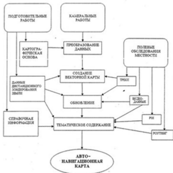
Рис. 2. Алгоритм підготовки автонавігаційних карт

формі. Накопичений світовий досвід створення автонавігаційних карт дозволяє говорити про існування загального алгоритму їх підготовки (рис. 2).