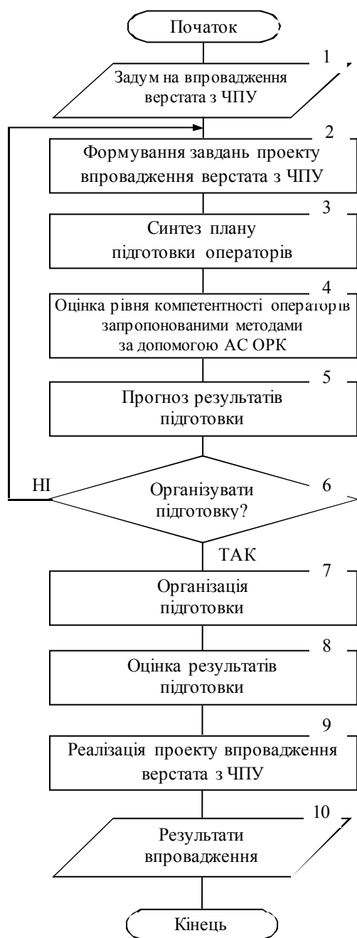
Рис. 3. Узагальнений алгоритм застосування АС ОРК

введення систем управління людськими ресурсами, пропонується використовувати автоматизовану систему оцінювання рівня компетенції фахівця технічного профілю в таких системах.