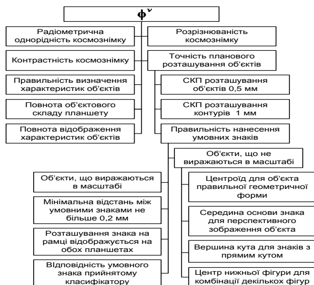
Рис. 2. Дерево показників кількісного оцінювання якості топографічного планшета