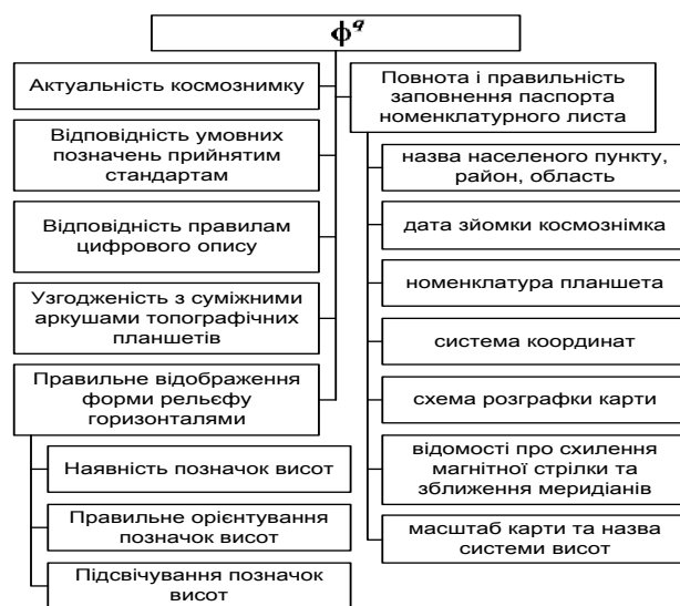
Рис. 3. Дерево показників якісного оцінювання топографічного планшета

Одиничний показник якості для критеріїв якісного оцінювання визначається таким чином