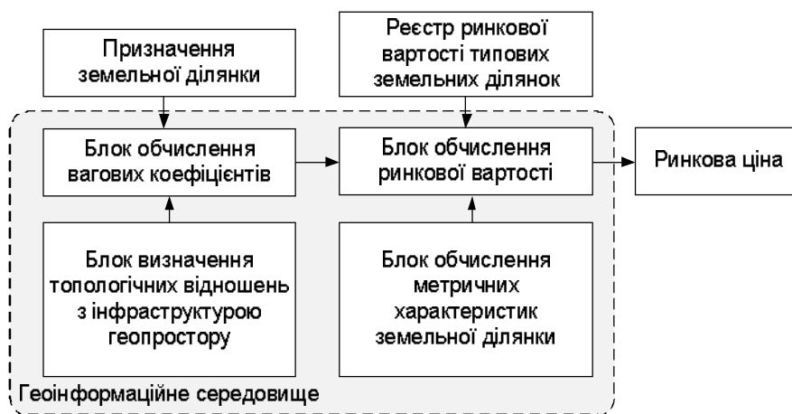
Рис. 1. Блок-схема механізму автоматизованого визначення ринкової вартості земельної ділянки

Для визначення цих коефіцієнтів пропонується підхід, що ґрунтується на зваженості характеристик оцінюваних земельних ділянок, посиленних, або послаблених чинниками зацікавленості покупців, і орієнтування вартості оцінюваної земельної ділянки відносно середньої комерційної вартості одиниці площі земельної ділянки в межах населеного пункту. Схематично механізм автоматизованої оцінки ринкової вартості земельної ділянки можна представити такою, дещо спрощеною схемою (рис. 1).