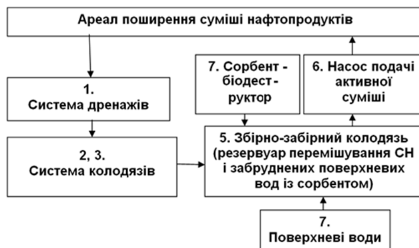
Рис. 4. Блок-схема очищення території від СН методом оборотної біоремедіації

Проаналізувавши результати власних спостережень та експериментальних досліджень щодо забруднення ґрунтових вод [1; 11], а також результати дослідження ДП «Водземпроект» ВАТ «Чернігівводпроект», нами була розроблена схема оборотної біоремедіації. Блок-схема представлена на рис. 4.