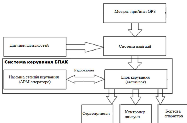
Рис. 3. Структура БпАК

Для формування вихідних груп показників якості розглянемо структуру БпАК (рис. 3), складовою якої є СК. У цій структурі наведені ті компоненти, що забезпечують реалізацію функцій керування, а саме: обробку, трансформацію і передачу даних, та інформаційно підтримують прийняття рішень щодо поведінки БпЛА, її зміни залежно від умов експлуатації.