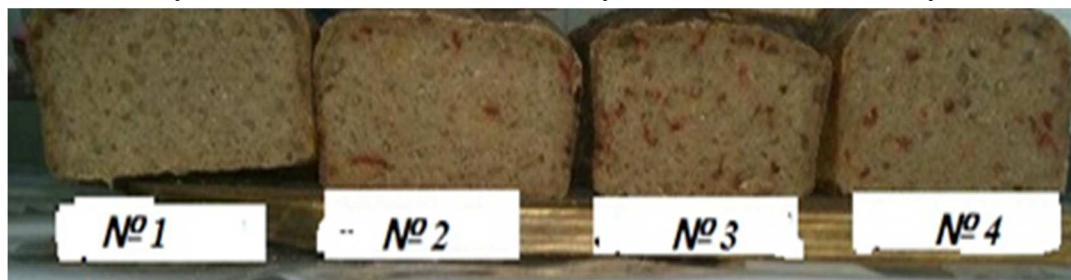
Рис. 1. Зразки випеченого хліба з різною концентрацією перцю Болгарського сухого: 1 – контроль; 2 – 2 % перцю; 3 – 4 % перцю; 4 – 6 % перцю до маси борошна

Якість хліба оцінювали шляхом проведення пробних лабораторних випічок тіста, що приготовані із житнього та пшеничного борошна на житній заквасці спонтанного бродіння з додаванням перцю Болгарського сухого в різному відсотковому співвідношенні, солі та контролю без перцю. За органолептичними показниками визначали форму хліба, колір і зовнішній вигляд скоринки, смак і запах (рис. 1). Оцінювали якість хлібної продукції за її фізико-хімічними властивостями – вологістю, кислотністю, пористістю. Фізико-хімічні дослідження проводили відповідно до діючих методик: вологості хліба – за ГОСТ 21094-75, пористості хліба – ГОСТ 5669-96, кислотності – прискореним методом ГОСТ 5670-96, крихкуватість визначали шляхом зважування крихт, що утворилися внаслідок струшування 5 г наважки в конічній колбі об'ємом 250 см 3 ; намокаємість визначали за методикою установаження кількості води, яку здатна поглинути м'якушка хліба.